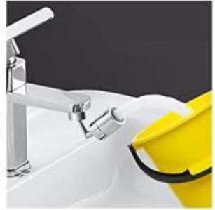
Pentru umplerea găleții