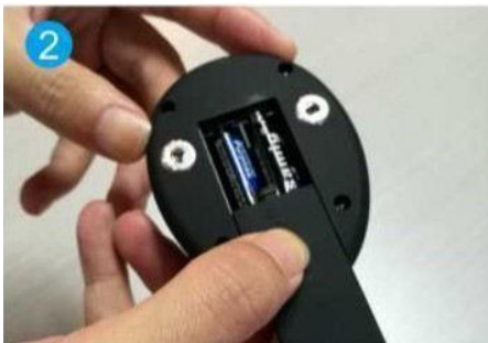
2. Plaats de batterijen (2xAAA)