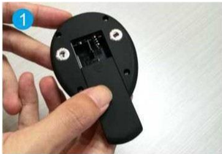
1. Open het batterijvak