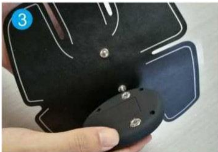
3. Bevestig de afstandsbediening aan het apparaat