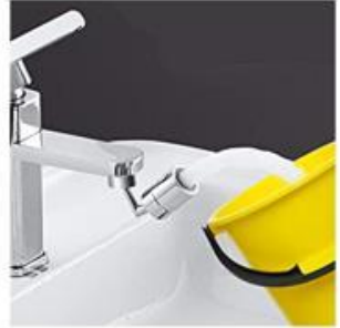
Tálak, vödörök megtöltéséhez