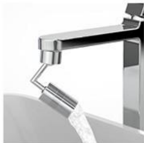
Smjer prema natrag