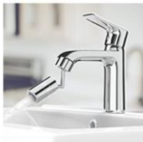
Smjer prema naprijed