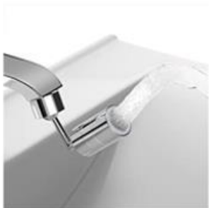
Namještanje u lijevu i desnu stranu