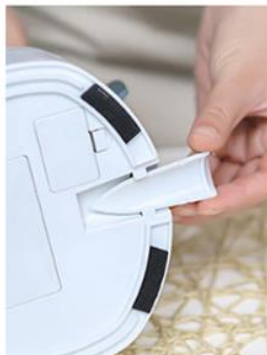
Nož za čišćenje na dnu