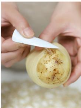
Ogulite ostatak s krajeva.