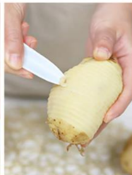
Uklonite eventualne ostatke kore.