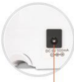
Priključak za struju

Gulilica se također može upotrebljavati s kabelom (bez baterija) uz strujni adapter (nije uključen).