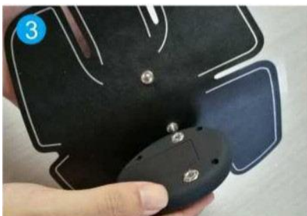
3. Kinnitage kaugjuhtimispult seadme külge