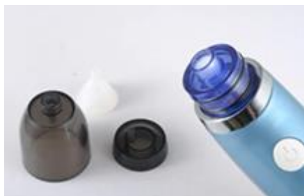
Součástky k instalaci.