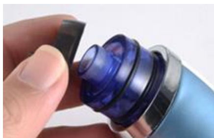
Nasadte kryt nádoby na hlen