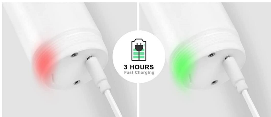
Red light when charging